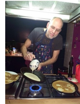
Herman aan het bakken

Een andere crowdfundingactie was de eindejaarsactiviteit bij de familie Toxopeus thuis. Via het mobiele netwerk en het internet ruchtbaarheid aan gegeven. Binnen 3 dagen lag er een bestelling van 500 'Afrikabollen'. Er werd hard gewerkt in huize Toxopeus om al deze bollen te bakken en te bezorgen. Gelukkig met hulp van vele vrienden.